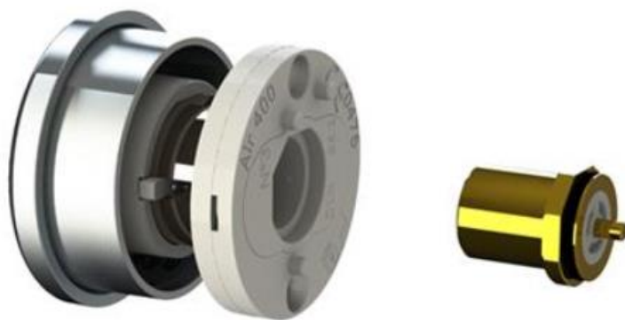
Sistema di manutenzione rapido/ easy maintenance system